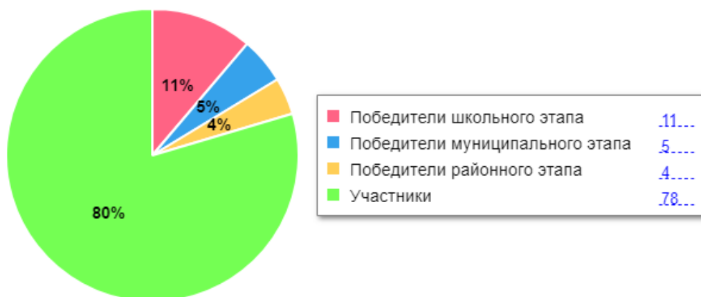
Диаграмма по результатам участия школьников во ВсОШ